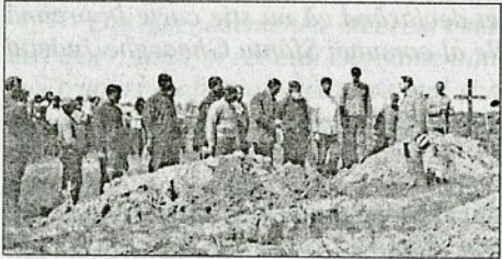
Înmormântarea victimelor