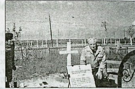
Placa memorială din marmură a fost așezată în cimitirul din Sfântu Gheorghe de către Sergiu Scadovschi - fiul contelui Alexander Skadowsky - fratele Mariei Falz-Fein - pe locul menționat de localnici, după distrugerea completă a mormântului familiei Skadowsky