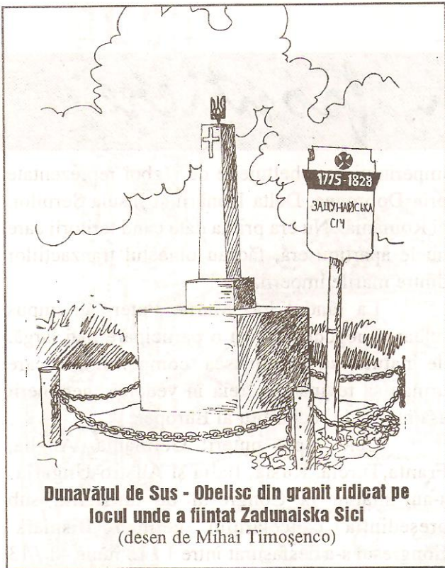
Dunăvățul de Sus - Obelisc din granit ridicat pe locul unde a ființat Zadunaiska Sici (desen de Mihai Timošenco)

persoane în Delta Dunării la pescuit. Inițiiază în Deltă cherhanale și pentru a evita deplasările anuale hotărâsc mutarea taberei din Seimenii Vechi în Deltă. Astfel, în anul 1812 pleacă de la Seimenii Vechi coborând pe Dunăre. Datorită iernii foarte grele din acest an sunt nevoiți să rămână la Isaccea. În primăvara anului 1813 coboară pe Sfântu Gheorghe spre Caterlez, astăzi localitatea Sfântu Gheorghe. Aici au rămas să se ocupe de pescuit dar au început să-și organizeze și Zadunaiska Sici. Apoi văzând că nu le ajunge spațiul și pentru agricultură, o parte din ei hotărâsc să se așeze la Dunăvățul de Sus unde se puteau îndeletnici și cu agricultura și cu creșterea vitelor, în afară de pescuit. Astfel, se înființează aici Zadunaiska Sici, care devine centru al cazacilor din localitățile Deltei și întregii Dobroge. Această organizație este una de tip militar, constituită după modelul "Zaporijjskaia Sici".